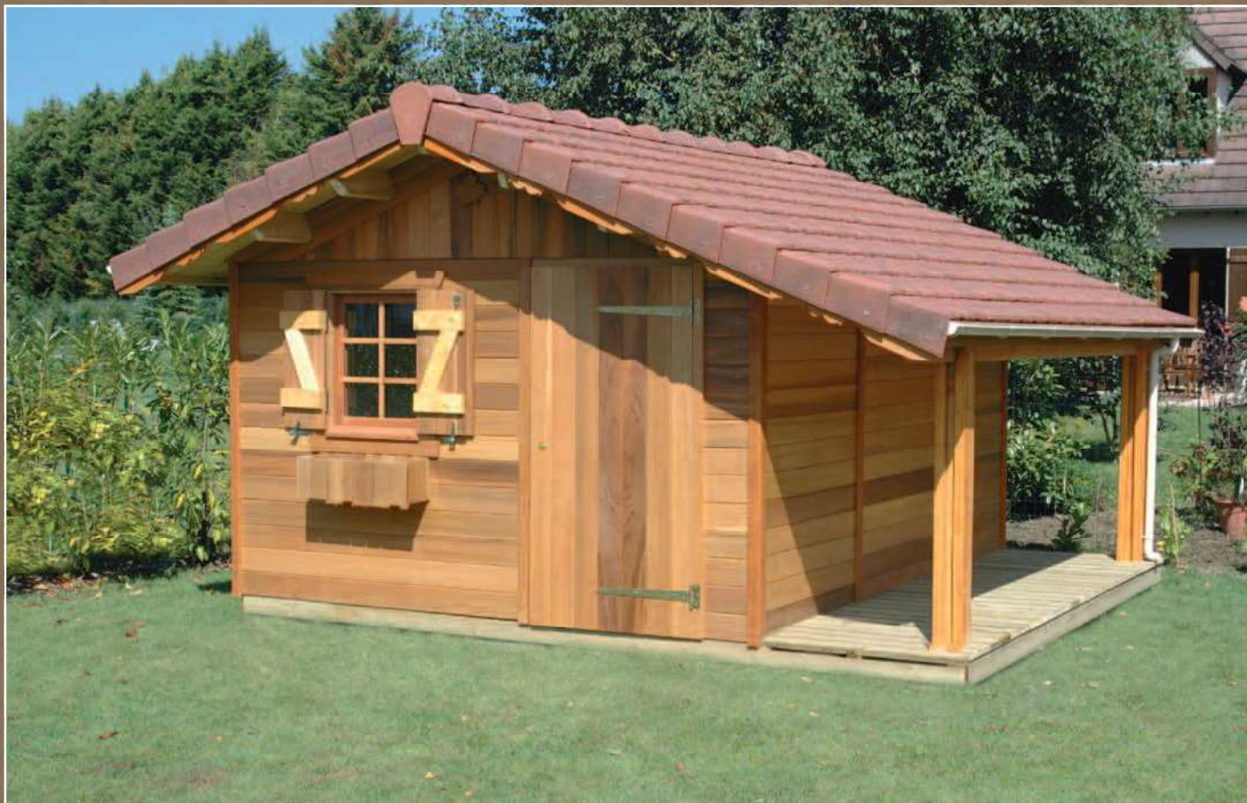
HONFLEUR 3,00 m x 3,60 m Red Cedar clear Options : bûcher 1,00 m sur le côté - plancher claire-voie pour bûcher - couverture tuiles terre cuite mécanique 22 au m 2 - gouttières couleur sable PVC 16 cm